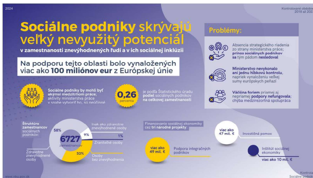
Obrázok 2: Sociálne podniky skrývajú veľký nevyužitý potenciál